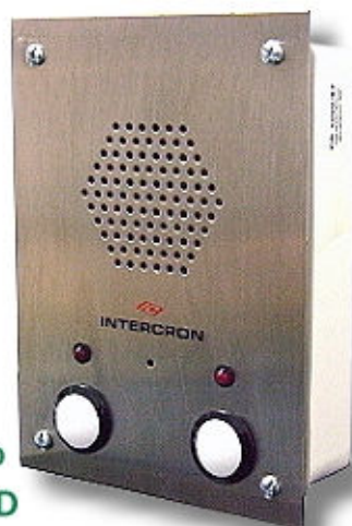
modelo IC RTA/D