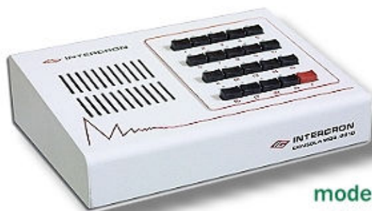
modelo IC 19