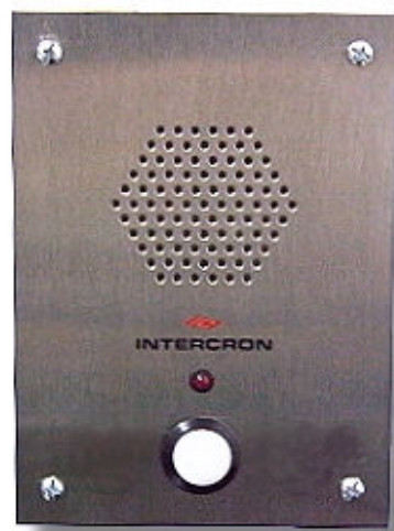
modelo IC RTA/S